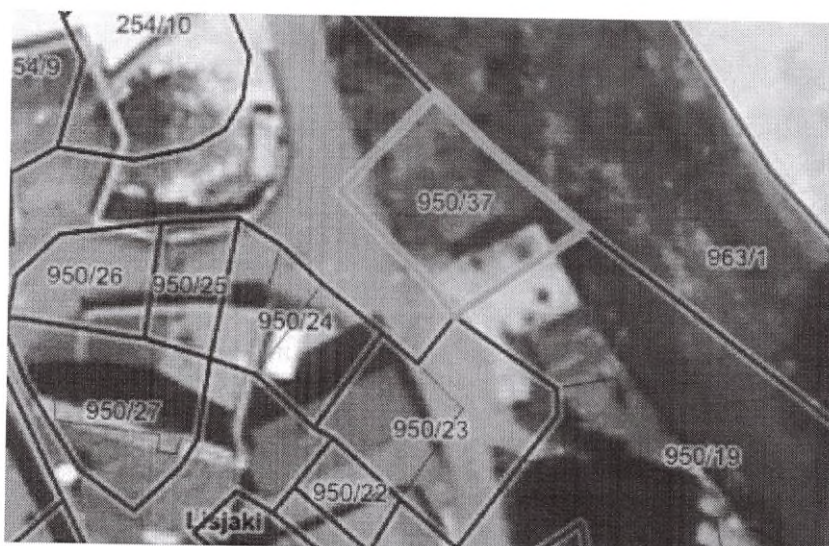
Parc. št. 950/37 k.o. Štanjel