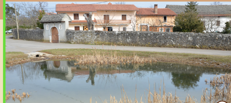
7 Tupelški kal

Pot zajema del starodavnih vodnih virov v okolici kraja. Namenjena je spoznavanju in ohranjanju naravne in kulturne dediščine Krasa. V pol-druhi uri lagodne hoje spoznamo, kako so bili nekoč kali pomembni za preživetje prebivalstva. Pot je speljana po suhi krajini in v zavetju borovcev, v manjšem delu pa tudi po vasi. Primerna je za hojo v vseh letnih časih, najlepša pa je v spomladanskih in jesenskih dneh.