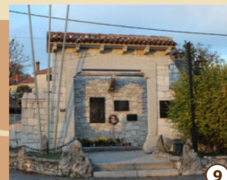
9 Spomenik NOB