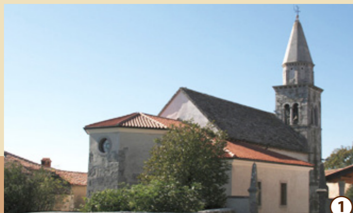
1 Cerkev svetega Mihaela

Kras je bil zaradi ugodne lege naseljen že od starejše kamene dobe. To dokazujejo tudi arheološka najdišča na našem območju: Jelenca jama, Nenča jama in Hrami, Ograda v Tupelčah in tudi najdbe iz prazgodovine in iz rimskih časov v Mercah. Zanimive so tudi najdbe v kamniti gomili na Rabotnici, ki je bilo eno izmed gradišč. Domačini pravijo, da je bil v gomili pokopan Atila. Skozi Kobjeglavo je vodila rimska cesta Via Gemina, ki je povezovala Oglej preko Vipavske doline z Ljubljano.