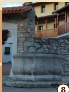
8 Štirna na Goricah

Kal sredi Tupelč so naredili sredi 19. stoletja. V njem so nekoč napajali živino, gospodinje so prale perilo, otroci so tu poleti plavali, pozimi drsali, ob kalu so se ljudje družili ob večerih. Leta 2006 so vaščani kal obnovili.