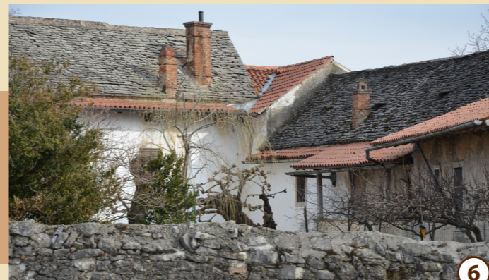
6 Petrova domačija

V Zančevo domačijo vstopimo skozi mogočno kaluno na borjač, okrog katerega so razporejeni stanovanjski in gospodarski objekti. Hiša je bogato okrašena s poslikavami in umetno izdelano ograjo ganka. Tudi notranjost hiše je lepo ohranjena; kuhinja ima star štedilnik in tla iz kamnitih plošč.