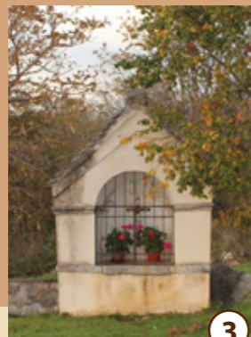
3 Pil pri Čotnih