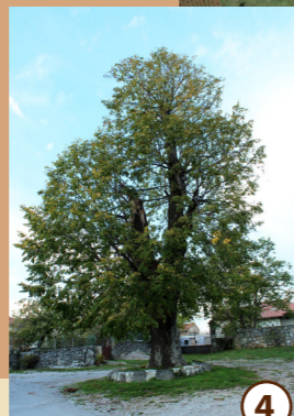
4 Vaška lipa