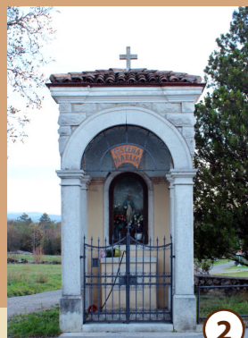
2 Kapelica Matere božje

Prva omemba cerkve datira v leto 1570, sedanjo obliko pa je dobila v 18. stoletju. Glavni oltar sv. Mihaela, delo Lazarinijeve delavnice, velja za enega najboljših kamnitih baročnih oltarjev na Primorskem. Sliki na stranskih oltarjih sta deli Jožeta Tominca in Johana M. Lichtenreiterja.