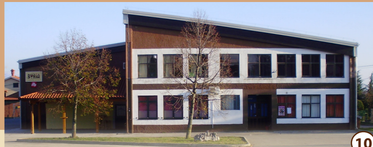
10 Vaški dom