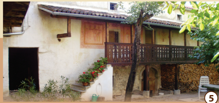
5 Zančeva domačija

V Zančevo domačijo vstopimo skozi mogočno kaluno na borjač, okrog katerega so razporejeni stanovanjski in gospodarski objekti. Hiša je bogato okrašena s poslikavami in umetno izdelano ograjo ganka. Tudi notranjost hiše je lepo ohranjena; kuhinja ima star štedilnik in tla iz kamnitih plošč.