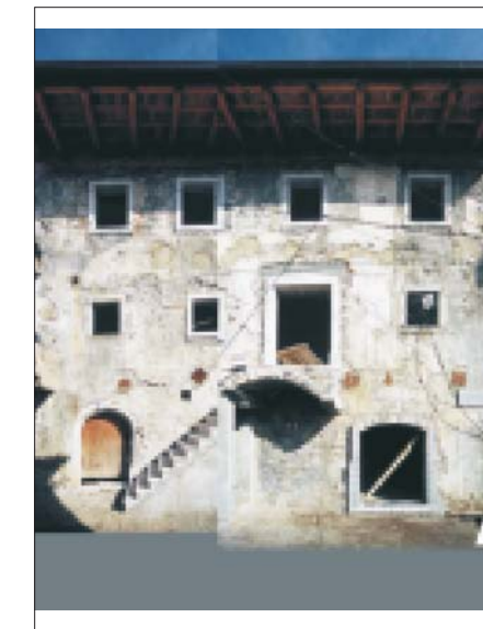
PRIKAZ FASAD - JUŽNI POGLED NA NIZ 14 - LIST 26