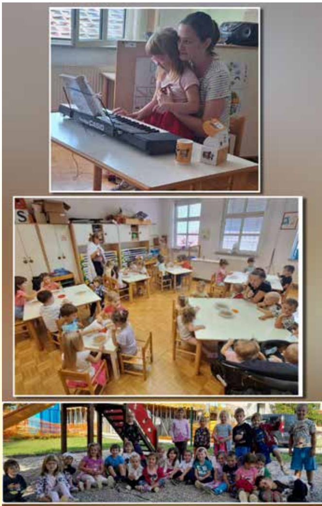
Besedilo: Mojca Mozetič

Mami Mojci Furlan se zahvaljujemo za čudovito glasbeno dopoldne.