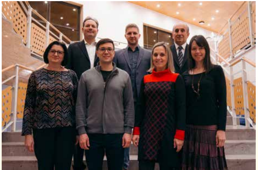
Kolektiv GŠ Sežana, podružnice Komen.

Zametki glasbenega izobraževanja na Krasu segajo že v leto 1951: tedaj je v Sežani potekal glasbeni tečaj, kjer so se otroci učili klavirja, harmonike, violine, klarineta in nauka o glasbi. Tečaj je pomenil dobro izhodišče za ustanovitev glasbene šole, ki se je zgodila 8. avgusta 1953 s sklepom Okrajnega ljudskega odbora Sežana. Tako se je pouk začel 1. septembra 1953 v prostorih Starega gradu na Partizanski cesti 41. Pogoji za delo še zdaleč niso bili najboljši, prav tako pa so se v naslednjih desetletjih kazale težave zaradi pomanjkanja ustreznih kadrov, zaradi česar je prihajalo do prekinitve poučevanja nekaterih inštrumentov. Zagnanost učiteljev in ravnateljev pa sta botrovala temu, da se je postopoma le pridobivalo ustrezne kadre. Najprej so ti prihajali iz okoliških mest in tujine, počasi pa je sadove obrodilo tudi kvalitetno delo profesorjev, ki so poskrbeli za glasbeni podmladek: nekdanji učenci, ki so se šolali na konservatorijih in akademijah, so se vračali na Kras in začeli polniti kadrovske vrzeli. Pouk se je skozi leta