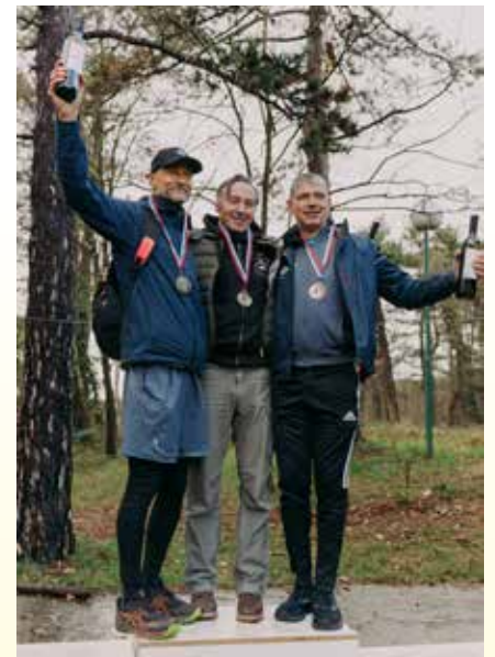
Izvedbo 22. Štanjelskega teka je omogočilo sofinanciranje Občine Komen in Fundacije za šport.