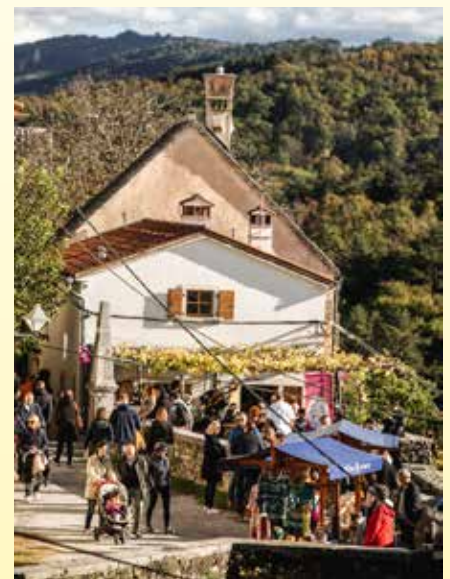
S soncem obsijani Štanjel je privabil rekordno število domačih in tujih gostov.

Martinovanje na Krasu se je sicer zaključilo, a odlični vinarji, pršutarji, sirarji, gostinci, drugi ponudniki in soorganizatorji številnih prireditev Martinovanja na Krasu vas gostoljubno pričakujemo celo leto. Vabljeni na jesensko obarvani Kras, med odlična mlada vina, izbrano kulinarčno ponudbo, očarljive kotičke, pristno gostoljubnost in dobre ljudi #visitkras!