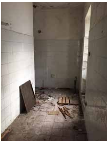
Garsonjera pred prenovo.

V kolikor želite tudi vi pomagati mamam in njihovim otrokom na poti v samostojno življenje brez nasilja, lahko