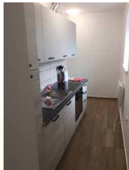
Garsonjera po prenovi.

Informacije o javnem socialnovarstvenem programu Regijska varna hiša Kras