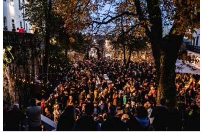
Okušanje odlične kulinarčne ponudbe in vin je znova navdušilo obiskovalce Praznika vina v Štanjelu.