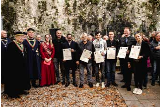
V okviru 4. ocenjevanja vin na gradu Štanjel pod okriljem vitezov vina smo razglasili najboljše mlade terane in najboljša mlada bela vina.