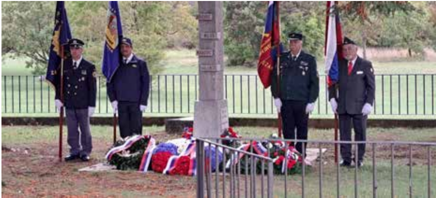
Praporščaki pri spomeniku Bazoviškim žrtvam.

miru in verjamem v prihodnost odprtih meja.«