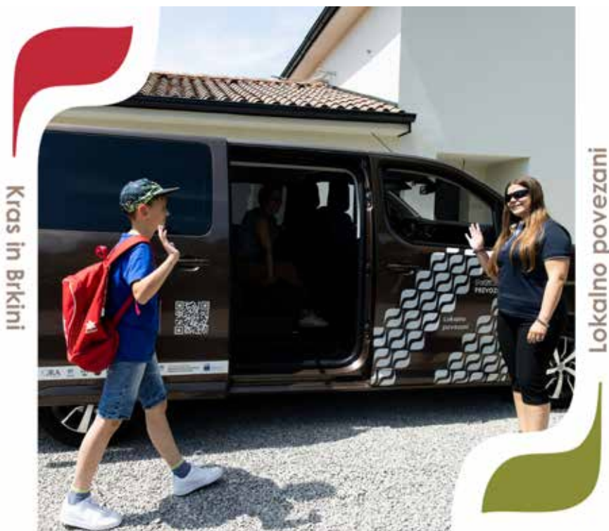
Kras in Brkini