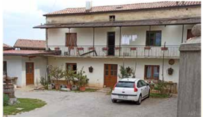
Boginova hiša danes.