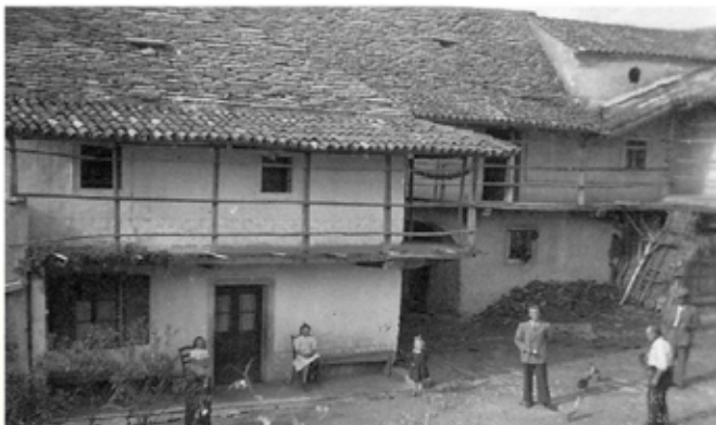
Stara Boginova hiša.

Zanimanje za razstavo je bilo precejšnje, zato je bila možnost ogleda vsako nedeljo v oktobru ob 10. uri dopoldne.