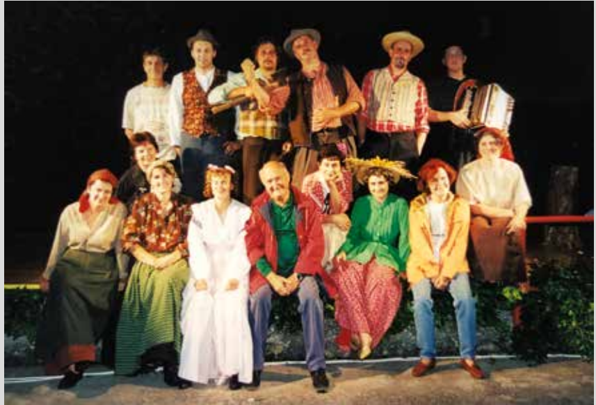
Dve nevesti, junij 2000.