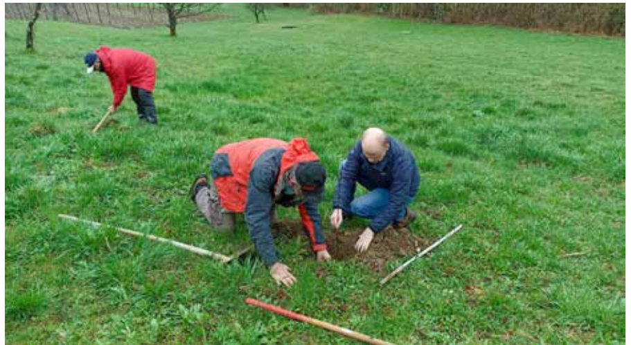
Saditev medovitih rastlin na našo prihodnost.

Prostor, ki ga želimo nameniti medovitim rastlinam, je odvisen od same velikosti. Lahko gre za cvetlična korita na