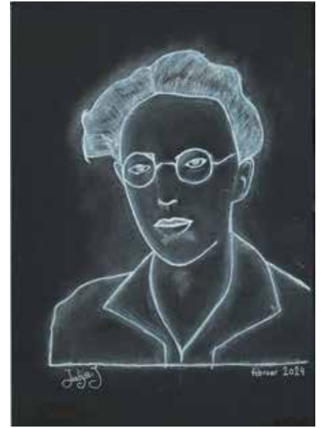
Besedilo: Marija Umek