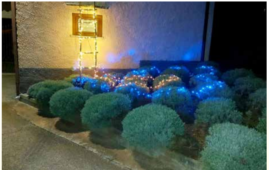
Besedilo: Tjaša Dugulin za Vaško skupnost Sveto in Društvo S'čanskih puntarjev