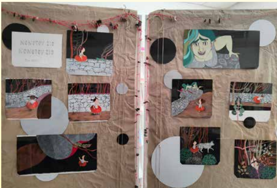
Ilustracije Nonotovega zidu na razstavi v Kosovelovi knjižnici Sežana.