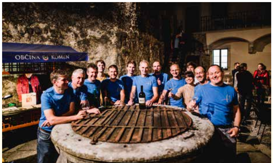
Del ekipe organizatorjev, ki že vsa leta skrbi za pripravo dogodkov.