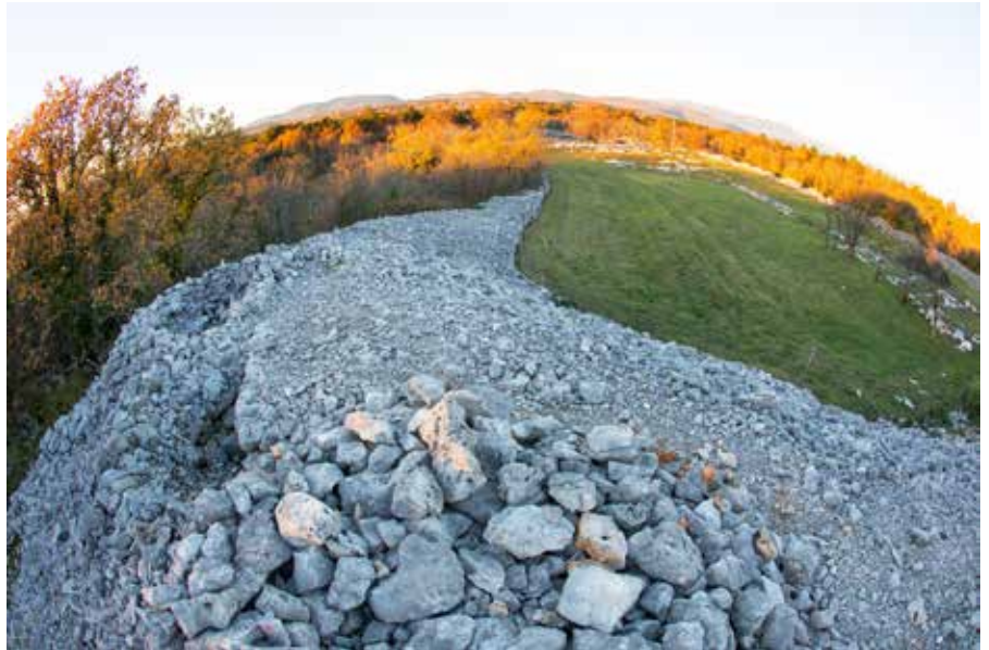
Pogled iz jugozahodnega vogala obzidja proti severnemu kraškemu robu, 2017.