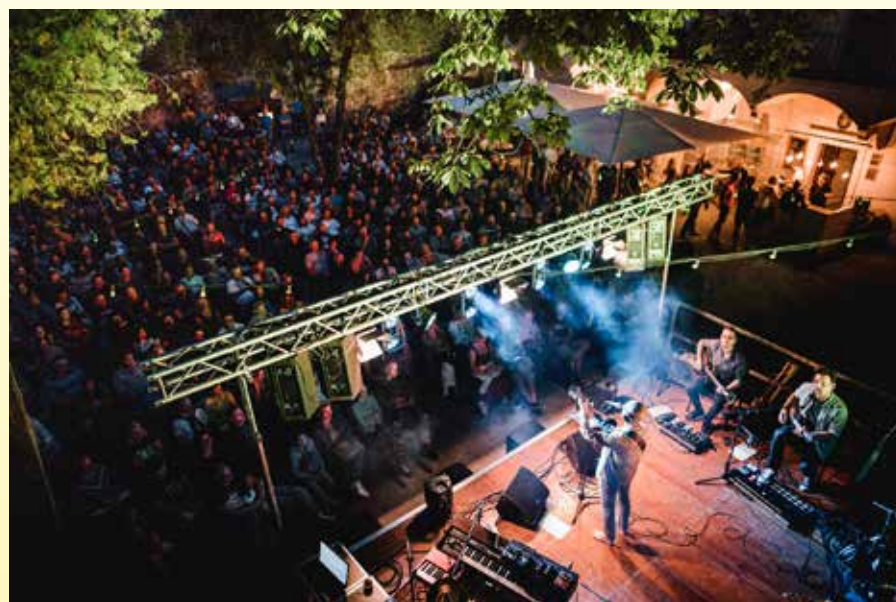
Napolnjeno grajsko dvorišče med koncertom.