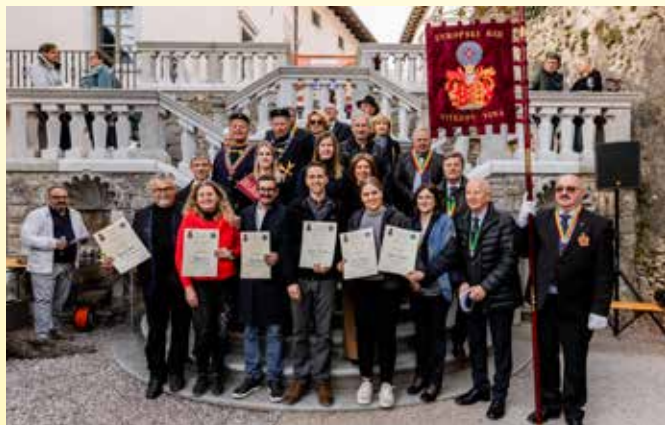
V okviru 5. ocenjevanja vin na gradu Štanjel pod okriljem vitezov vina smo razglasili najboljše mlade terane in najboljša mlada bela vina.

Ob zaključku prireditve vas vabimo na Kras – med odlične ponudnike, ki vas pričakujemo celo leto. Vabljeni na raziskovanje jesenske barvitosti območja, med odlična mlada vina, izbrano kulinarčno ponudbo, očarljive koticke, pristno gostoljubnost in dobre ljudi!