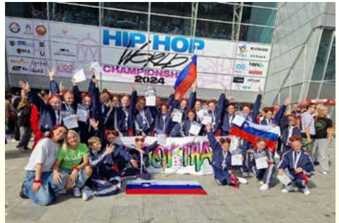
Besedilo: Plesni center ADC