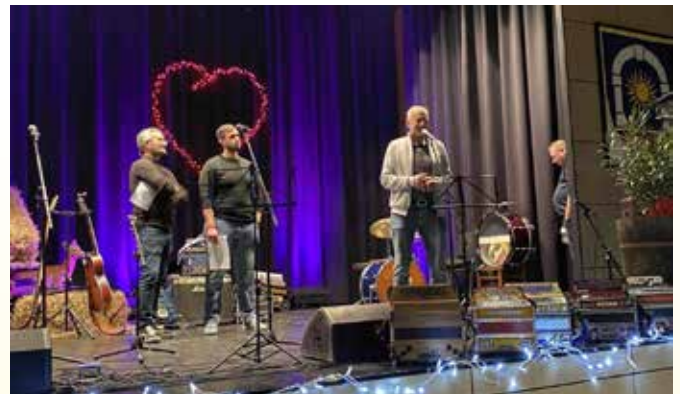
Besedilo: Andreja Klemše