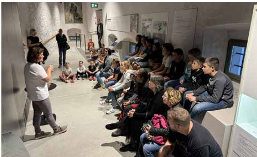
Besedilo: Marja Filipčič Mulič