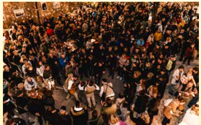
Okušanje odlične kulinarčne ponudbe in vin ob glasbeni spremljavi je kot vedno navdušilo obiskovalce Praznika vina v Štanjelu.