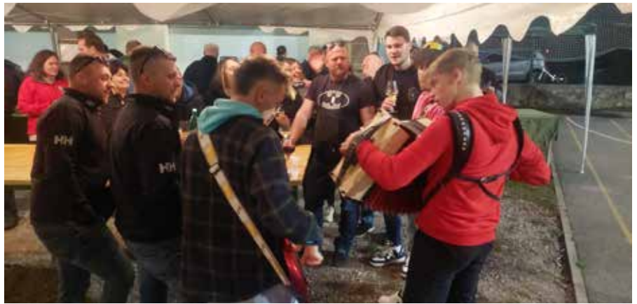
Tudi dogajanje »martinovanje po domače« v Gorjanskem je bilo zelo dobro obiskano.

Praznik vina v Štanjelu je ob najpomembnejšem prazniku vinarjev in vinogradnikov s Krasa postregel tudi s 5. ocenjevanjem mladih vin pod vodstvom strokovne komisije Vitezov evropskega reda vitezov vina. Med mladimi terani je strokovna komisija najbolje ocenila teran