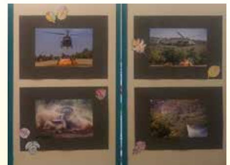
Besedilo: Tanja Spačal