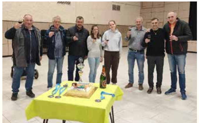
Besedilo in foto: Balinarski klub Hrast