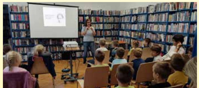
Kulturni dan v knjižnici

Besedilo: Marija Umek