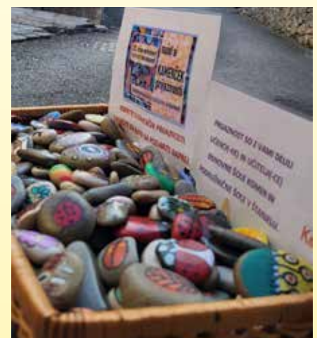
Besedilo in foto: Tanja Spačal

Poskušajmo pa prijaznost tudi prepoznati, saj prebiva v vsakem izmed nas.