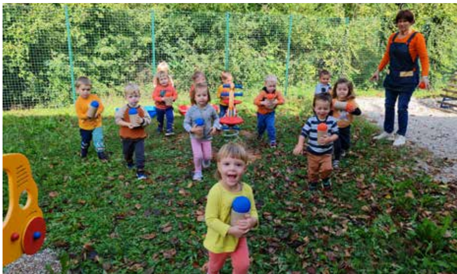
Besedilo in foto: Metka Vrtovec

Prvi jesenski dan, znan tudi kot jesensko enakonočje, kar pomeni, da sta dan in noč enako dolga, smo obeležili kot oranžni dan. Praznovali smo ga v ponedeljek, 23. septembra. Ta dan so otroci v vrtec prinesli različne oranžne stvari (avte, plišaste igrače ...) in bili oblečeni v oranžne majice, hlače ali nogavice. Strokovne delavke smo jim pripravile fit poligon, na katerem so krepili različne spretnosti. Navdušeno so plezali po vrvi, se urili v metanju žogic v tarčo, prenašali barvne žogice v posode ustreznih barv, skakali čez ovire, se kotalili in s hojo po brvi krepili svoje ravnotežje. Oranžnega dne so se otroci zelo veselili in zavzeto sodelovali na vseh postajah fit poligona.