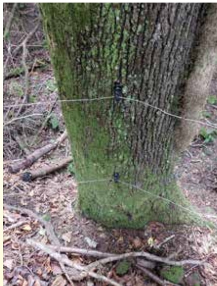
Primer nepravilne pritrditve žice na živo drevo pri ureditvi pašnika v gozdu

Napredno pašništvo je našlo način, kako zmanjšati negativne učinke pašne na gozd in hkrati izkoristiti pozitivne učinke