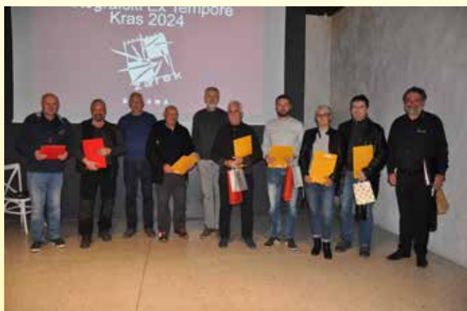
Nagrajenci in prejemniki diplom