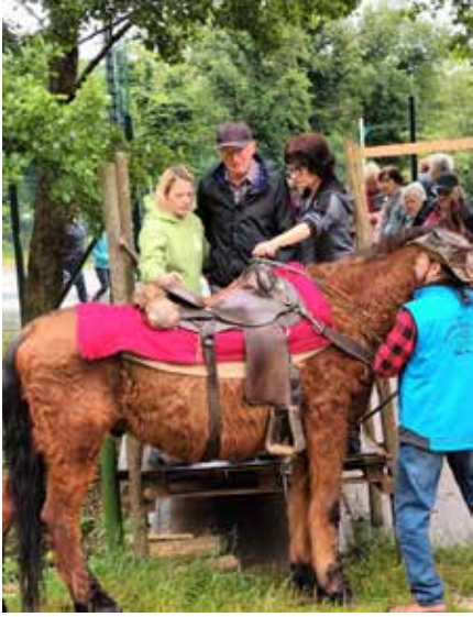
Terapevtska podpora, da se „kapnik“ lahko udeleži hipoterapije.

pozitivne energije, brez jamranja in stokanja, z nasmehom na obrazu. Res jih lahko občudujemo! Prehojena pot od Tivolija do Prešernovega trga pomeni marsikomu več kot meni vzpon na Nanos! Ampak VZTRAJAJO, le tiste, ki res ne zmorejo, poberejo prostovoljci z vozički, ki ves čas spremljajo pohodnike. Lahko se samo učimo od takih ljudi in ne jokamo za vsak „zlomljen noht“. Na Prešernovem trgu je potekala lepa in čustvena prireditve, ki se je nadaljevala z druženjem „kapnikov“ iz različnih slovenskih klubov. V vseh letih so se med njimi stkala že kar lepa prijateljstva. Druženje se je nadaljevalo s skupnim kosilom v gostišču Livada na obrobju Ljubljane.